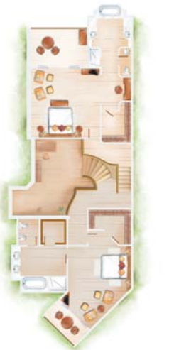
Demi-étage & Premier Upper level & Top floor