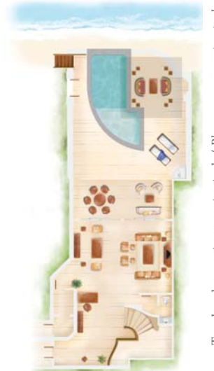
Rez-de-jardin / Ground floor